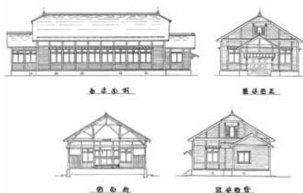
聖徳太子宮女学校議定建築設計書 大正十年四月

室、右側に便所が配置されていました。尾籠な話ですが便所の構造図面には地下便槽として堤焼の大甕が記されているのは時代を感じさせます。敷地北端の養蚕室棟は、教育目標に添った実業殖産教育の要の施設と窥えます。