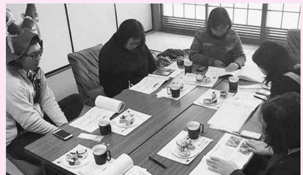
写真)学んだことを即実践し、Facebookページを絶賛運用中じゃ。

Facebookをご利用中の皆さんは、お得な情報が入手できるかもしれないので、ぜひ「いいね!」してみてください。