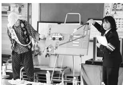
シルバー交通安全教室

交通安全運動期間中や月4回の定例街頭指導を実施し、通行する児童や生徒、ドライバーに交通安全を呼びかけています。