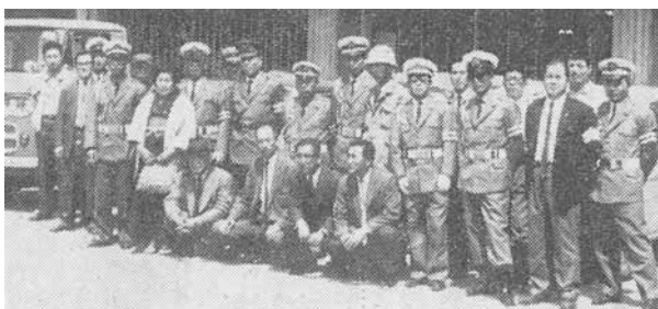
昭和42年4月21日に役場で行われた指導員の任命式 (広報わくや昭和42年5月号掲載写真)

なお、平成29年の交通事故件数は、人身事故36件(26件減)、死者0人(増減無)、負傷者48人(26人減)、物損事故312件(48件増)でした。しかしながら、平成30年に入り交通事故発生し、1人の尊い生命が失われました。一層の交通ルールの順守をお願いします。【( )内前年比】