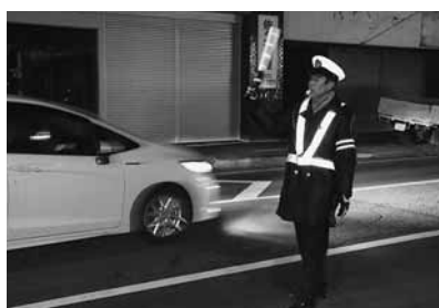
事故・災害現場での交通誘導

近年増え続ける高齢者の交通事故を減らすため、高齢者を対象とした交通マナーを啓発する交通安全教室を実施しています。