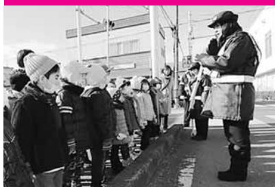
こじかクラブ交通安全教室

町内の園児を対象に、生涯にわたって交通安全意識を高く持てるよう、交通ルールを指導する交通安全教室を実施しています。