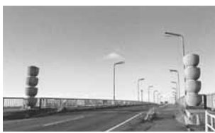
写真は涌谷バイパスにある新涌谷大橋のモチーフです。この新涌谷大橋のモチーフは町木の「杉の実」をかたどったものです。

町花、町木、市花、国花に至るまで、花や木の特性とその地の人々の心が密接に結びついており、とても興味深く感じます。