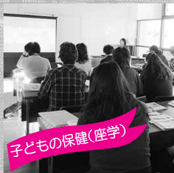
子どもの保健(座学)