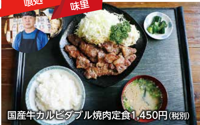
国産牛カルビダブル焼肉定食1,450円(税別)

ここでしか味わえないメニューが豊富で、リーズナブル・ボリューム・おいしさの三拍子がそろった味里。