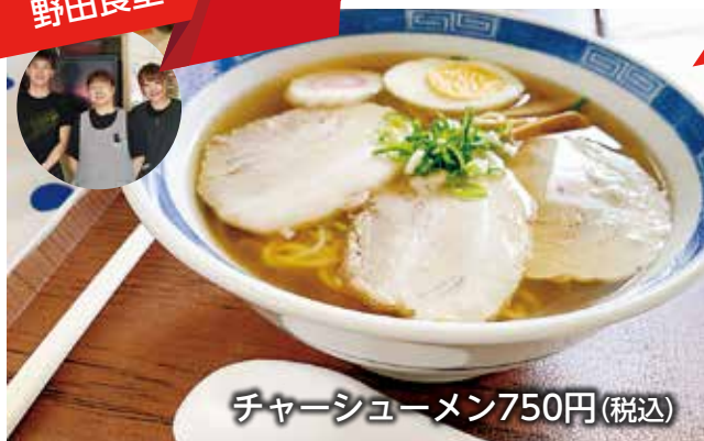
チャーシューメン750円(税込)

60年以上地域から愛される野田食堂。現在は家族3人で営み、素敵な笑顔が印象的なお店です。