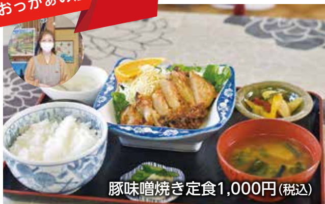
豚味噌焼き定食1,000円(税込)

赤い屋根が目印のおっかあの店。近所だけではなく長距離トラックのドライバーや営業周りの営業マンのお昼の憩いの場として親しまれています。お客さまに満足してもらうためにと、定食はボリューム満点!