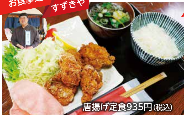
唐揚げ定食935円(税込)

和食屋ならではの味付けの大きな唐揚げが5つも皿に乗る唐揚げ定食。さらに、デカ盛り好きにうれしい2倍盛りのでんこもり(1,430円税込)も。女川出身の店主が仕入れ旬が味わえるお刺身定食(1,870円税込)もおススメ。