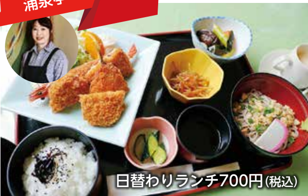
日替わりランチ700円(税込)

ミックスフライの他、しょうが焼き・からあげなど全7種類からメインを1つ選び、ミニそばかミニうどん(温・冷)がつけられる豪華なランチ。コロナ対策として始まったテイクアウトの各種お弁当(650円税込)も好評です。