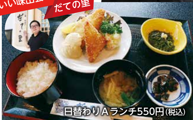
日替わりAランチ550円(税込)

日替わりでメインと小鉢が変わるランチは、なんと550円(税込)というお手軽価格ですが、大きな満足感が得られます。同じく550円(税込)で食べられるカレーライスも人気です。