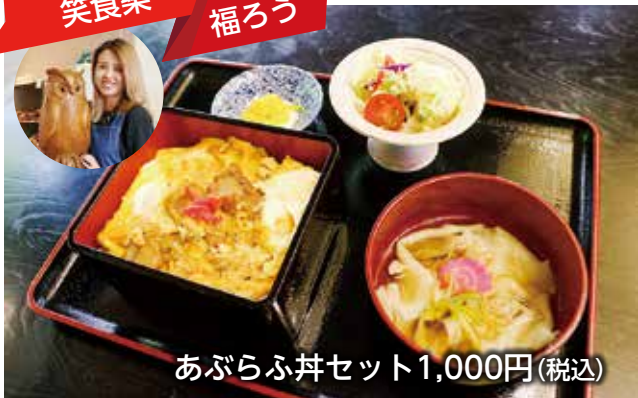
あぶらふ丼セット1,000円(税込)

古くから食べ継がれてきた宮城の郷土料理「はっと」専門店。わくわくするほどのバリエーション豊富なはっと料理の他、麺類や定食、喫茶メニューを取り揃えています。