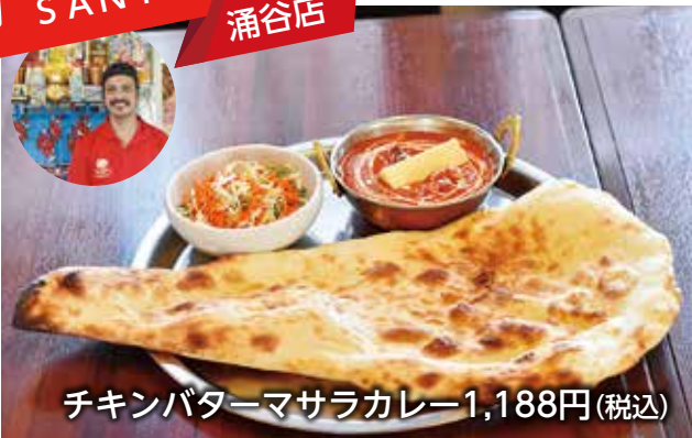
チキンバターマサラカレー1,188円(税込)

インドやネパールなど出身の料理人たちが本格的な現地の味を生かしたまま、日本人でも食べやすくする研究が重ねられたオリジナルスパイスのインドカレーを提供。焼きたてもちもちのナンと一緒にどうぞ。