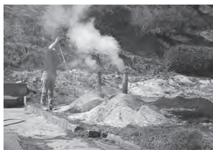
(写真) 春陽の下で苗床用の籾殻を焼く

②灰は、数千年前から行われた焼畑農業では唯一の肥料でした。古いかたちの農業で、雑木林の草木を伐採し、乾燥させて火を放ち、灰が残る地面に、そば、ひえ、かぶ等の種を撒きました。地表を耕さず、肥料も撒かず収穫しました。灰の多い畑は収穫も多く、近年まで農村・山村で盛んに行なわれました。通谷辺りでは、昭和時代でも苗代の畔に大豆を撒き、根元に籾殻の灰を撒いたものです。今でも稲の苗床に籾殻の灰を撒きます。何れも、肥料としての効果を知るからで、見慣れた農作業の中にも歴史の経験を