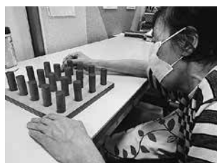
(左) ホットパック (中) 自転車エルゴメーター (右) 指先運動

当施設では、専門職がそれぞれの利用者様にあったリハビリメニューを組んで行っています。