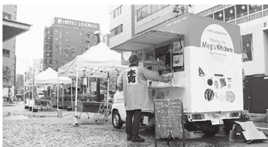
10月16日に仙台市青葉区本町商店街に出店

キッチンカーを始める時に一番やりたかったことがやっとならぶとできるわくわくしています。お邪魔したその場所でも多くの人に涌谷町を知ってもらおうこと、私が作った料理で涌谷食材の魅力を感じてもらおう