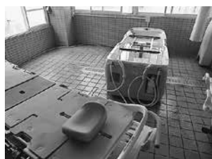
(左) 一般浴 (中) チェアインバス浴 (右) ストレッチャー浴

当施設では、一般浴に天平の湯と同じ温泉を使用し神経痛、関節痛、疲労回復、冷え性などに効果があります。