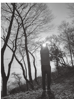
麓岳山で撮影に挑戦中の私です。

涌谷町民になりたての新米家族ですが、町で見かけたら声をかけていただけたら嬉しいです。これからどうぞ宜しくお願いいたします！