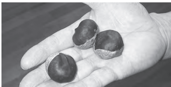
とちの実一岩手県立農業科学博物館

①絹、木綿、麻糸への染色に使われました。紫染めは樺の木灰、藍染めは檜の木灰、紅花染めは稲藁の灰と、染料ごとに使い分けました。 古人は樹木に命を認め、神の依代と感じ、崇拜し、その観察は鋭く「杉と楠は舟とし、松は宮殿に、槇は棺に」と記録し、樹木の最良の用途を熟知しています。さらに深く、樹木ごとの「灰」の効用を知るなど、知識の深さに驚かします。 ②縄文時代(約4、5千年前)の住居跡から煮炊きと灰溜めの二つの炉が発掘されます。人々が食糧とした、ナラ、カシ、トチ、クヌギ等の実のあく抜き用の灰を得るためです。今でも、ゼンマイ、ワラビ、 タケノコ、フキノトウなど山菜のあく抜きに使い、その知恵は継承されています。 ③昔、涌谷辺りではどぶろく、に稲藁の灰を水に入れて、上澄みを注ぎました。酸化し、すっぱくなり、腐るのを防ぐためです。安全で確実な中和防腐剤として大いに役立ちました。みそ・しょうゆ等の製造にも利用されてきました。灰は目に見えずとも役割を果たしていたのです。