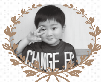
黄金区 澁谷 月神くん らいむ