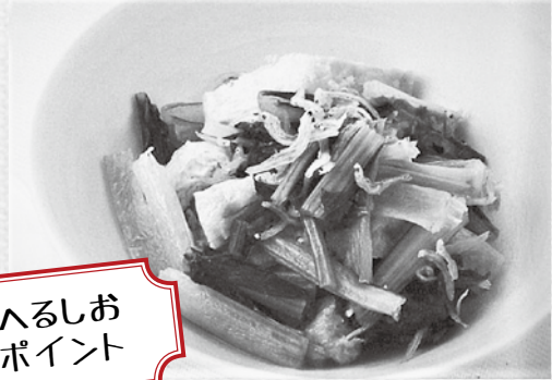
へるしお ポイント

③葉の部分をのせてぴっちりふたをし、中火にかける。しんなりとなるまで3~4分ほど煮て、火を消して全体を混ぜる。