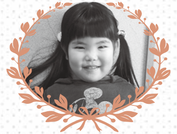
八雲区 はな 坂下 はなちゃん