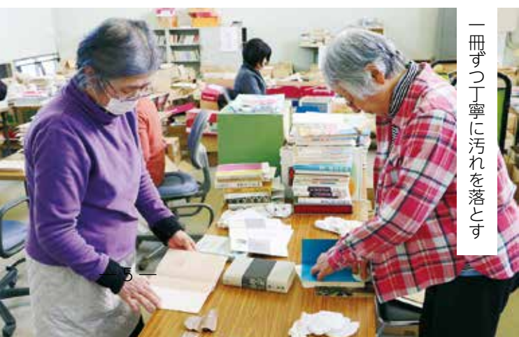
一冊ずつ丁寧に汚れを落とす

司書などの有資格者を中心とした図書室再開委員会ボランティアの皆さんが、1年間以上の時間をかけて図書の再分類やクリーニングに携わっていただくことで再開できました。