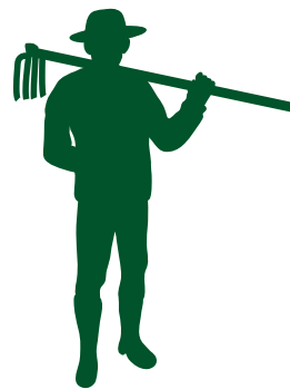
農業委員会会長あいさつ