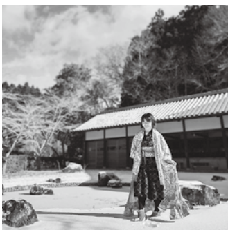
和服をリメイクした衣装で町内を散策しています。

自分の仕事という面を見てみると、「夢は叶わない」という長い人生誰もがかかる呪いの言葉に悪酔いしていました。抱いていた日本赤十字社本社で福祉学習に携わりたい夢は散り、千鳥足での迷走が始まりました。学生の頃から行っていたフライダルアテンド、イベントMCにナレーション、披露宴演奏に、ライターに秘書。そして、潰れる道をたどったデザイナーピスの生活相談員。さあ、人に見せられない履歴書の誕生です。