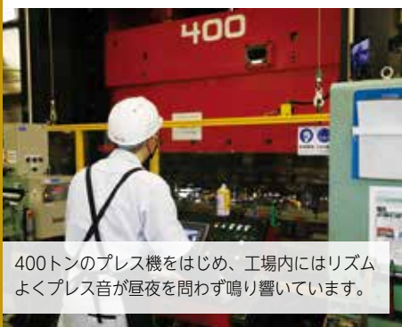
400トンのプレス機をはじめ、工場内にはリズムよくプレス音が昼夜を問わず鳴り響いています。