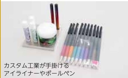
カスタム工業が手掛ける アイライナーやボールペン