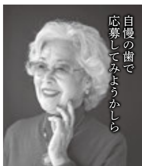
自慢の歯で 応募してみようかしら